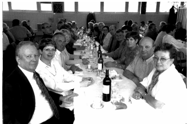
Les représentants de la promo 59