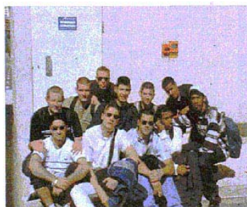
La promo 2000/2002 au PRCI de Marseille.

Leur période d'apprentissage s'est achevée par la visite du PRCI (2) de Marseille. Cette journée a été mise à profit pour mieux connaître les installations nouvelles du TGV Med. Une nouvelle promotion de 15 apprentis est entrée le 4 septembre 2002. Nous leur souhaitons la même réussite que leurs aînés.