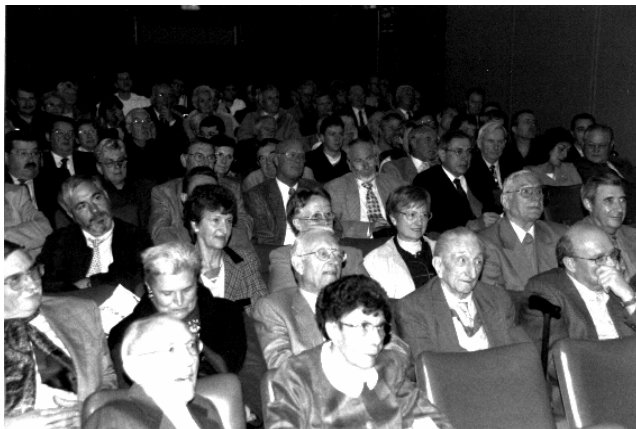
...et de l'autre !