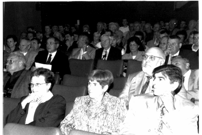
Des Amicalistes à l'écoute d'un côté...